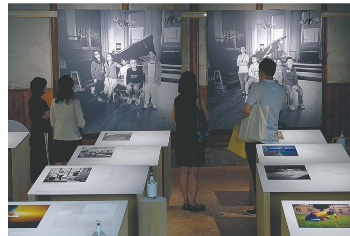
「見る写真」と「触る写真」が並ぶ会場

対話鑑賞は午後2時～午後5時。視覚障害がある人は☎070(4291)3977、もしくは、メールinfo@kyotographie.jpで参加を受け付ける。目が見える人はKYOTOGRAPHIEのウェブサイトの事前予約から申し込む。1日3組まで。